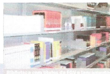
Biblioteca com livros da FGV e lançamentos