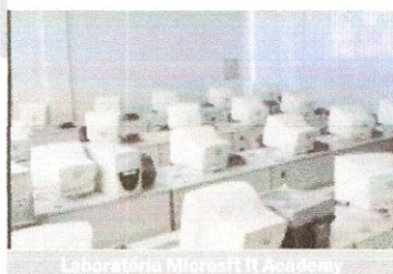
Laboratório Microsoft IT Academy