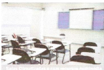
Salas Climatizadas e com recursos multimídia

A ESUP – Escola Superior de Negócios , mantida pelo Grupo Empresa Recursos Humanos , é um grupo empresarial goiano que, desde 1989, identifica e qualifica profissionais para o mercado nacional. Acreditando na capacidade de desenvolvimento da região através da educação, a ESUP , por meio do Programa de Certificação de Qualidade da FGV, trouxe para o mercado goiano um Novo Conceito de Ensino Superior , obedecendo criteriosamente os padrões de qualidade pedagógica e de estrutura física. Possibilita através de seu corpo docente, qualificado e formado pela Fundação Getulio Vargas, uma educação pautada no desenvolvimento e profissionalismo. Entre seus diferenciais, estão: o Conselho Consultivo Empresarial , formado por representantes de 10 empresas dentre as maiores do Estado, e o Projeto EduCar , em parceria com a Unidade de Recursos Humanos do grupo, que visa Educação e Carreira, aproximando o aluno do mercado. Sua infra-estrutura oferece: salas de aula multimídia e climatizadas, laboratório de informática, biblioteca atualizada, segurança 24 horas e estacionamento fechado.